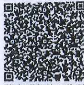
徐立群年检二维码

本证书经检验合格，继续有效一年。 This certificate is valid for another year after this renewal.