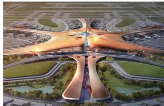
北京大兴国际机场