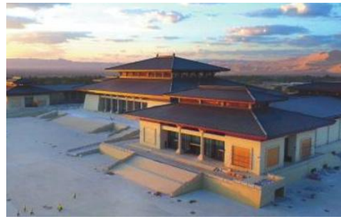
敦煌国际会展中心