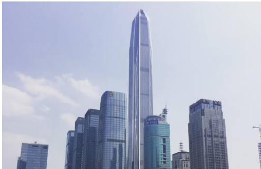
深圳平安金融中心