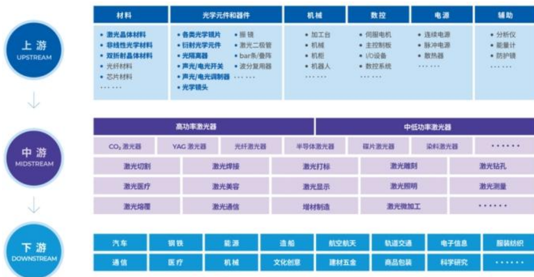
激光行业产业链示意图

打标、钻孔、清洗、测量、熔覆、医疗、增材制造等设备；下游应用场景持续拓展，主要包括先进制造、医疗健康、科学研究、汽车、新能源、消费电子。半导体与集成电路、信息技术、光通信、光存储等领域。