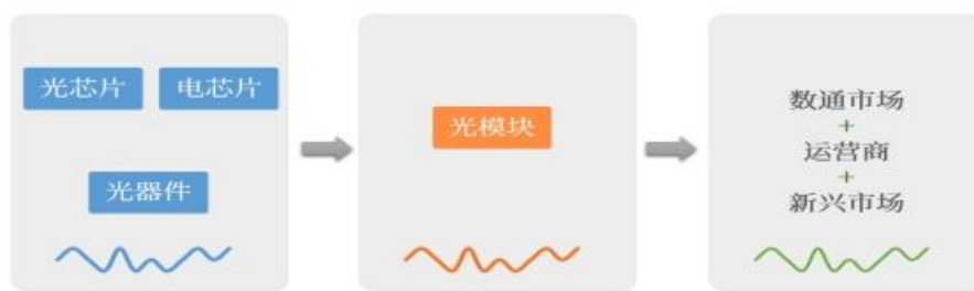
光模块产业链图示

元件的指标精度和可靠性直接决定光器件、光模块及光设备的光学性能与运行稳定性，是光通信产业发展的重要基础支撑。