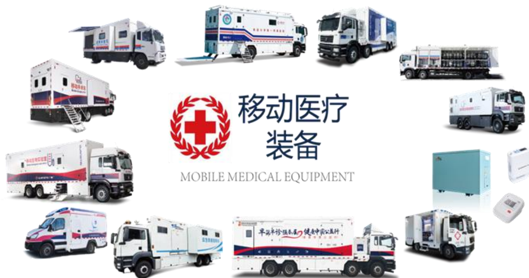
移动医疗保障装备示意图