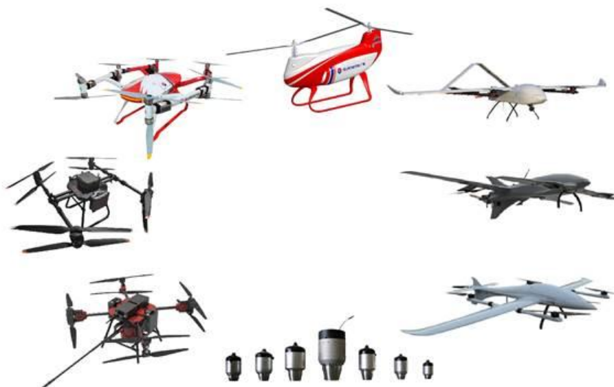
无人机装备示意图

公司瞄准低空经济中的应急救援重要应用场景，研发了大载重长航时多旋翼无人机、大载重纵列双旋翼无人直升机、垂起、多旋翼无人机等。产品可应用于消防灭火、应急救援、物流运输等领域，可搭载物流运输箱满足物流场景需要；搭载救援担架、安全舱，以满足应急救援需求；搭载灭火弹以应用于森林消防；搭载泡沫消防带以满足城市高层住宅灭火需求等。该型无人机可以与应急救援保障装备业务协同作战，是应急救援市场未来的重要发展方向。