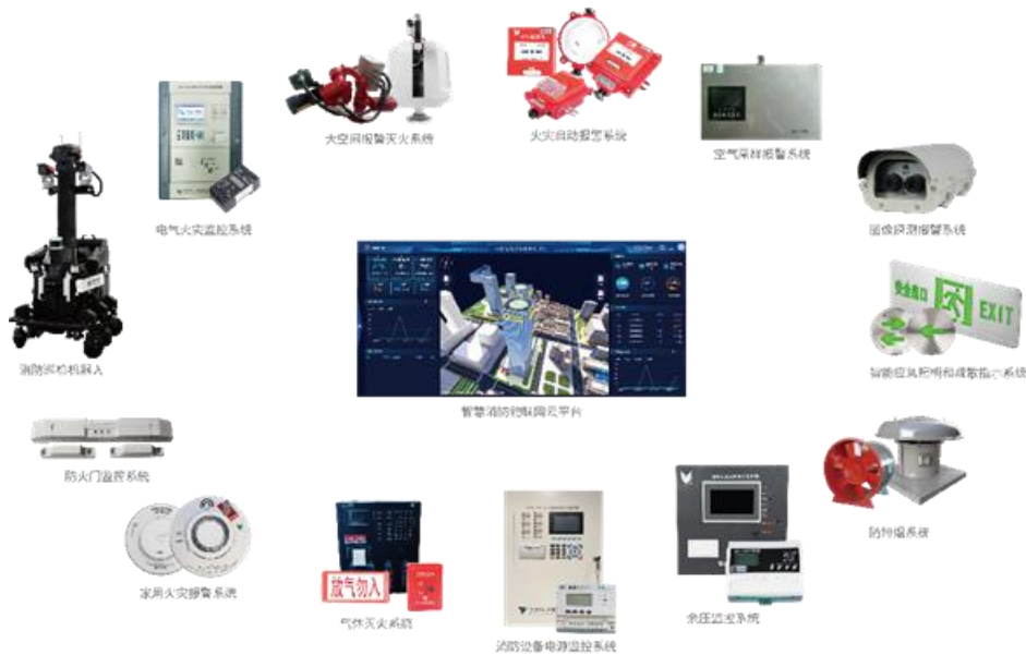
消防报警装备示意图

三水一电监测系统、火灾自动报警系统、大空间灭火系统、智能应急照明和疏散指示系统、电气火灾监控系统、消防电源监控系统、防火门监控系统、余压监控系统，以及智慧消防物联网平台、智慧消防远程值守平台等，全方位满足不同场景下的消防安全防控、监测、预警与处置需求。