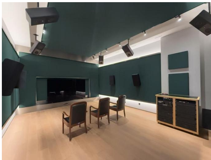
图 2 标准全景声视听室

公司的研发和创新基于整车音响的系统化、深度化、智能化多个维度，围绕声学软件与算法、新型材料、产品结构、仿真技术等方面开展。自 2024 年上海车展发布全套自研的 AI 全景声车载音响系统以来，研发团队不断优化迭代产品硬件和软件技术。AI 大模型的应用，可以更好地发挥车载硬件的性能，对音源进行自动处理后匹配车载环绕声系统，提升车内乘客的聆听体验。通过不断优化算法技术，分区声场、主动降噪、AVAS 声浪模拟等功能的实车效果进一步提升。报告