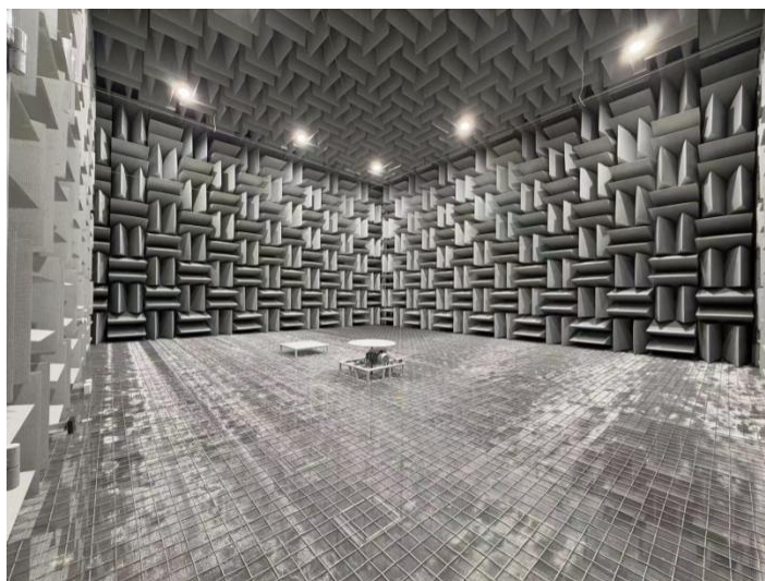
图 1 全消声室

发测试需求，精确把控声学参数指标，公司新建了声学实验楼，同时对原有的声学测试场所进行了扩建改造，测试场所面积由 2000 平米扩充到 6000 平米。建成投用了全消声室、半消声室、整车声学调音室以及标准全景声视听室，并获得权威机构的认证，成为行业领先水平，可满足公司自身以及客户对声学产品的研究、调音测试等需求，为公司与整车厂企业对产品技术提升、联合开发、深度合作奠定坚实基础。报告期内公司新增主观调音师 1 人，调音专家团队扩充为 13 人，向客户交付了多个整车调音项目。