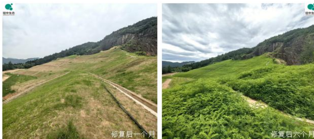
江西抚河流域某历史遗留废弃矿山生态修复项目实施后实景图

以及人工（无人）岛礁等的生态修复。报告期内，公司实施的上述典型项目主要有浮梁县废弃矿山绿色生态修复治理项目、江西抚河流域历史遗留废弃矿山生态修复示范工程、邹平市南部山区荒山造林综合治理项目施工（一标段）等。