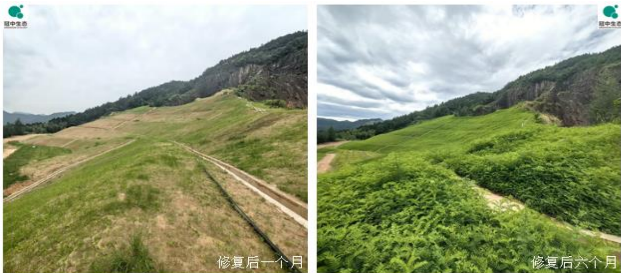
江西抚河流域某历史遗留废弃矿山生态修复项目实施后实景图

自然环境生态修复为公司的主导业务，秉承“为环境服务”的理念，使待修复区域恢复或具备自然环境应有的生态功能和生态结构，并能持续健康演替发展。该业务依托公司独特的生态修复系列技术（如团粒喷播植被恢复技术和优粒土壤制备工艺等）展开，业务覆盖矿山生态环境治理，荒漠化、石漠化和水土流失综合治理，道路边坡等基础设施建区的生态修复，及部分海域、海岸带和海岛综合整治，河流、湖泊与湿地修复，污染场地治理等。尤其是针对土壤瘠薄或者根本没有土壤（如裸岩边坡）、水土流失问题严重、风沙大、气温低、无霜期短等立地条件特别恶劣的待修复区域，公司可以实现快速、规模化造林，实现待修复区域植被恢复与生态功能重建，且修复后区域内的新建植物群落与原生植被呈现自然融为一体的效果，人工痕迹极少，解决了传统的、常规的绿化技术手段修复范围小和修复效果差的难题。公司近年来通过土壤改良、植物配置和工艺与装备等方面的持续创新提升，不断拓展技术应用场景，发力细分市场，形成了几大优势拳头业务即高寒高海拔区域、湿陷性黄土区域、各种岩质矿山、污染严重矿山和尾矿坝以及人工（无人）岛礁等的生态修复。报告期内，公司实施的上述典型项目主要有浮梁县废弃矿山绿色生态修复治理项目、江西抚河流域历史遗留废弃矿山生态修复示范工程、邹平市南部山区荒山造林综合治理项目施工（一标段）等。