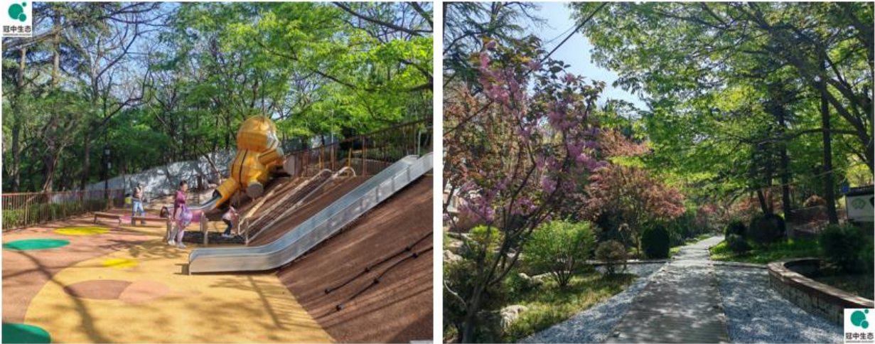
青岛市某公园改造提升项目实施后实景图

质提升基础设施建设改造项目施工 4 标段、青岛虚拟现实创享中心斜坡屋面项目、青岛市市北区公园城市适儿化设施提升工程、2025 年美国费城花展项目活动策划、设计及搭建项目等。