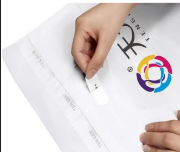
可二次使用快递袋

(1) 主要包括快递袋、背胶袋等产品。 (2) 用于装纳快递物品、单据、发票等。 (3) 根据客户需求与实际应用场景，公司生产的塑胶包装产品可选用优质原生塑料或符合国家标准的再生塑料；在满足产品质量与核心功能前提下，为践行绿色可持续发展理念，对适配品类优先选用合规再生材料。杜绝使用有毒、有害次生料，部分塑胶耗材产品具备多次使用的功能。 (4) 公司可生产连卷袋系列等特殊工艺快递袋，带条号码、带易撕带、带骨条等特殊工艺背胶袋产品，充分满足客户不同需求。 (5) 根据客户需求，可在塑胶包装表面印制指定信息，分为标准型产品与个性化定制型两类产品。