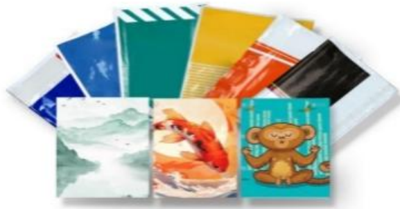
大客户定制快递袋