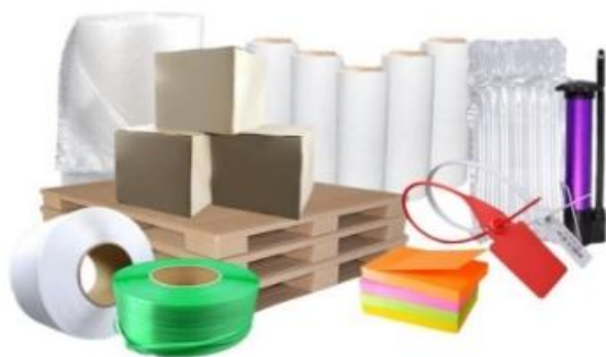
葫芦膜（袋）、气枕填充物等