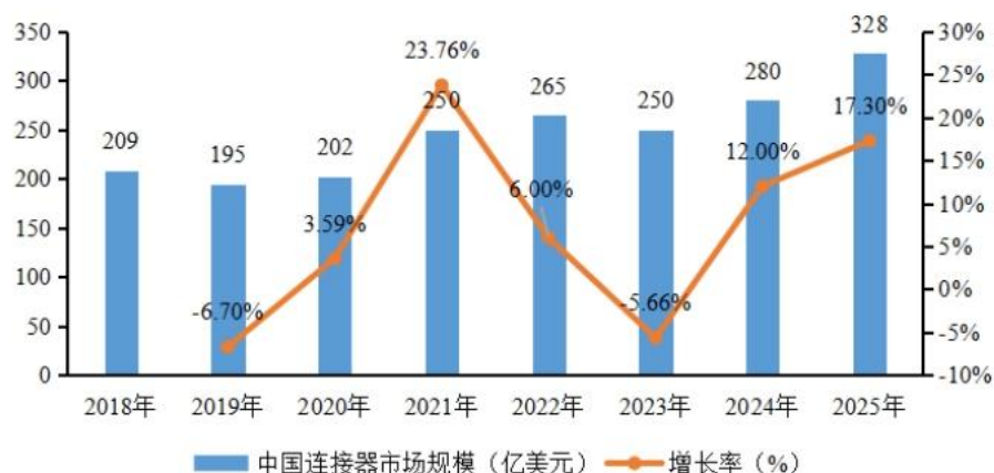
中国连接器市场规模及增长率

根据 Bishop & Associates 的数据，2018 年至 2025 年中国连接器市场规模由 209 亿美元上升至 328 亿美元，期间 CAGR 为 6.65%。在产业政策利好与下游市场需求持续扩大的双重驱动下，中国连接器制造厂商正凭借成本控制、快速响应与本地化服务等综合优势，不断拓展市场份额。随着研发投入的加大与产品品质的稳步提升，中国企业已在技术实力与产品可靠性方面建立起显著竞争力，在全球连接器产业格局中占据日益重要的地位。