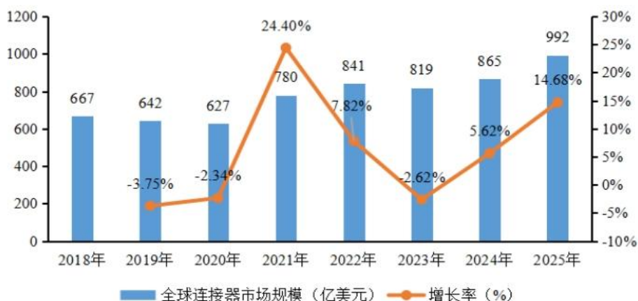
全球连接器市场规模及增长率

Bishop & Associates 数据显示，全球连接器市场规模从 2018 年的 667 亿美元上升至 2025 年的 992 亿美元，期间 CAGR 为 5.83%。展望未来，随着全球数字经济设施建设、汽车电动化和智能化转型等，高端连接器的需求将进一步释放，推动连接器行业结构持续优化，有望为行业带来持久的增长动力。