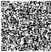
么爱翠的年检二维码

本证书经检验合格，继续有效一年。 This certificate is valid for another year after this renewal.