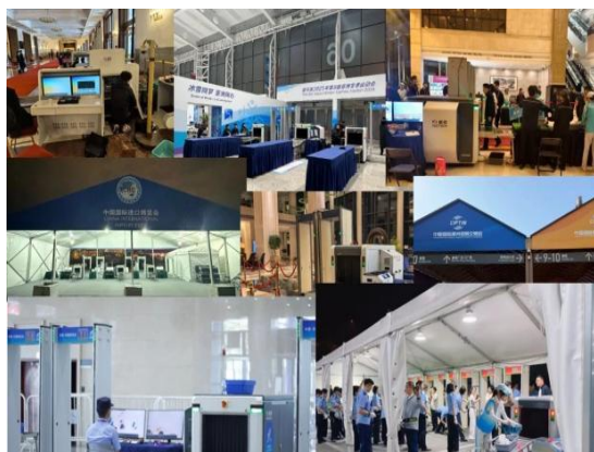
公司公共安全解决方案护航重大活动