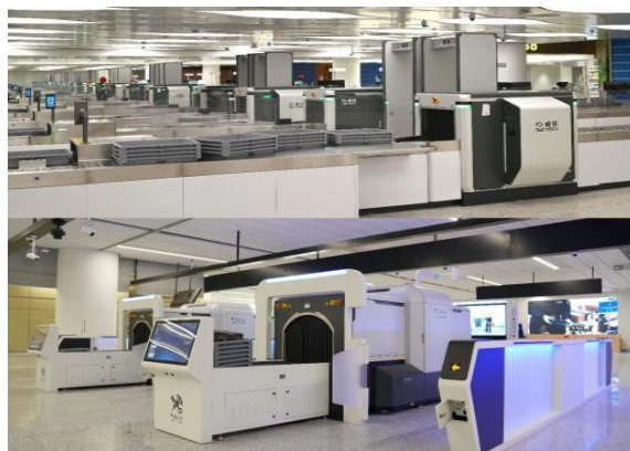
公司智慧解决方案助力广州、西安机场智能化升级

数智产业： 公司依托在高质量可信数据资源、人工智能、政企市场方面的优势地位及核心技术，全面整合内部资源，打造统一的数智产业平台。在数智产业，公司定位为“数据要素与人工智能双轮驱动的世界一流数智科技平台”，以“数据要素、人工智能”两轮驱动，聚焦“知识服务”和“数智转型服务”两大主营业务方向。在知识服务领域，公司依托 CNKI 平台，为全球 3.5 万家机构及 1.5 亿个人用户提供学术资源检索、知识管理及智能问答等服务。核心产品包括 CNKI 系列数据库、CNKI AI 工具及知网 AI+图书平台等。盈利模式以机构订阅为主，辅以个人按需付费等。在数智转型服务领域，公司以自研华知大模型为技术底座，面向政务、企业等行业提供智能化解决方案。核心产品包括定制化的行业数智化解决方案、数字化转型方案与系统等。盈利模式涵盖技术授权、软件设计与开发等。