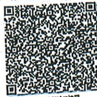
纸质证书的年检二维码

本证书经检验合格, 继续有效一年。 This certificate is valid for another year after this renewal.