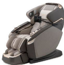
AI按摩机器人超感至臻版