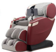
AI按摩机器人2.0探索版