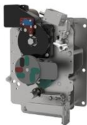
环网柜组合开关单元操作机构