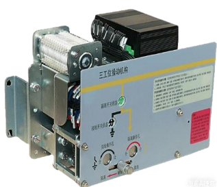
GIS 直动式三工位机构