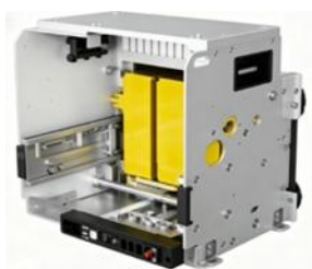
低压断路器框（抽）架