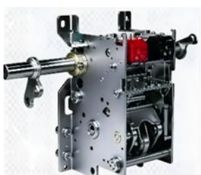
低压断路器操作机构

公司主要从事以断路器、环网柜和 C-GIS 开关柜为代表的中低压配电设备及其关键部附件的研发、生产和销售，系目前我国中低压配电设备及关键部附件行业中研发、生产、服务能力位于前列的企业之一。公司产品主要用于新型电力系统的配电装备、设施以及光伏、风电、储能等新能源配电和控制场合，包括低压、中低压断路器用框（抽）架、操作机构、附件和智能环网柜及其断路器单元操作机构和开关、负荷开关单元操作机构和开关、组合电器单元操作机构及开关、C-GIS 断路器单元操作机构和开关等。