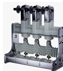
环保型环网柜断路器单元