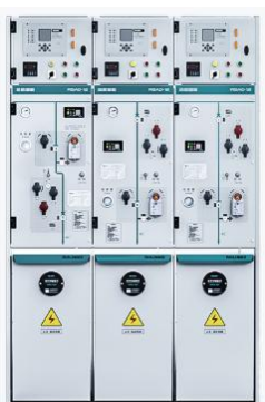
环保气体绝缘环网柜