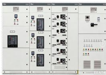
国网标准化低压开关柜