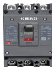
低压塑料外壳式断路器