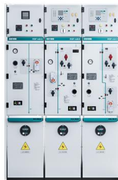
SF 6 气体绝缘环网柜