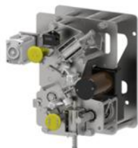
环网柜断路器单元操作机构