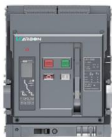
低压小型化框架式断路器