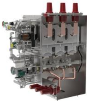
环保型环网柜断路器单元气箱