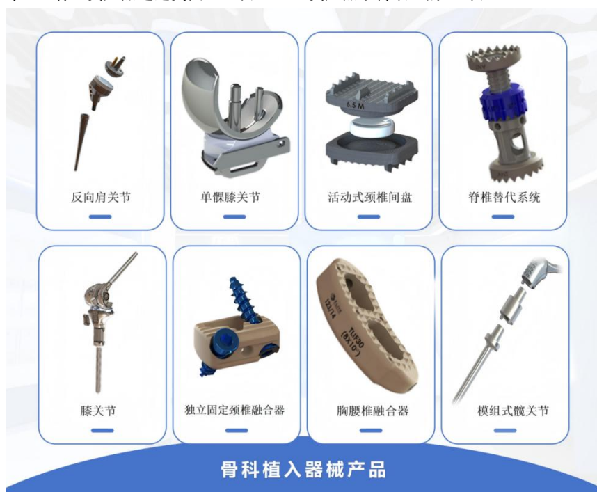
骨科植入器械产品