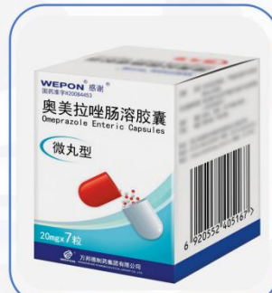
奥美拉唑肠溶胶囊

适用于胃溃疡、十二指肠溃疡、应激性溃疡、反流性食管炎和卓-艾综合征（胃泌素瘤）。