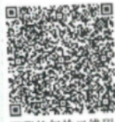
两码的年检二维码

本证书经检验合格，继续有效一年。 This certificate is valid for another year after this renewal.