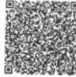
上页的年检二维码

本证书经检验合格，继续有效一年。 This certificate is valid for another year after this renewal.