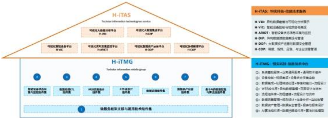
物联网大数据技术产品规划图

设计目标，坚持一次设计开发多处复用、成果永不丢失的设计原则。其设计理念是：持续改善架构设计、持续积累复用组件、持续积累技术标准、持续积累业务模型、持续覆盖物联网大数据应用全领域。