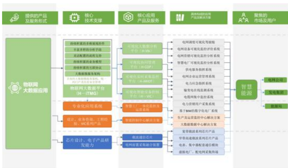
技术及产品战略图