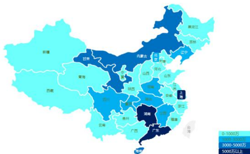
过去三年公司电力行业业绩分布

报告期内，公司凭借行业领先的技术实力，成功中标国家电网、南方电网多个数字能源及物联应用建设项目。2024 年中标的国网华东分部调度大屏显示功能改造项目和南网数字电网研究院云景建设项目，展示了公司在物联接入、边缘计算、数据服务、数据分析、数据应用及展示等方面的核心优势。这些项目为国家电网、南方电网的数字化转型提供了强有力的技术支撑，进一步巩固了公司在电力行业数字化服务领域的领先地位。