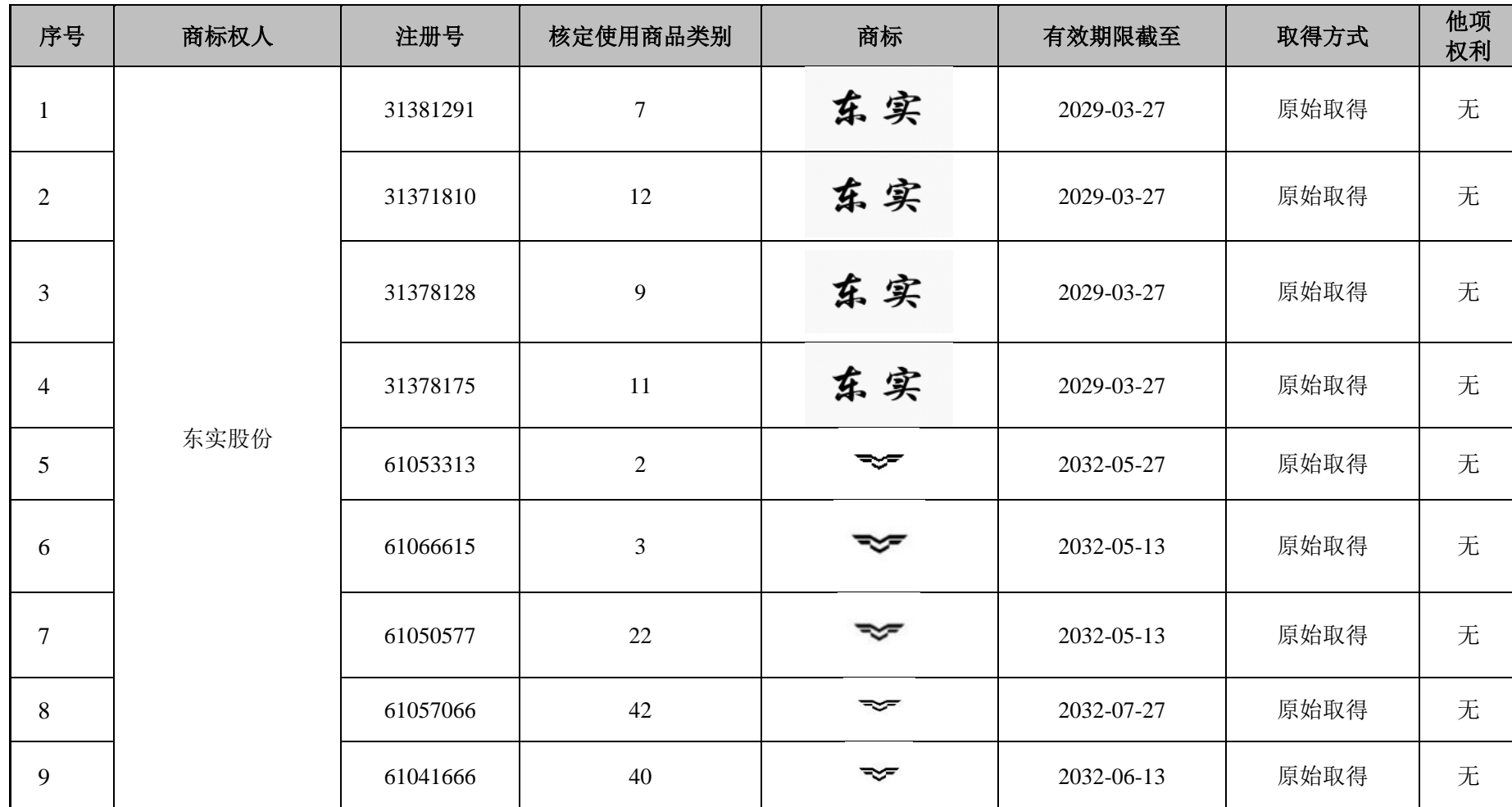
附表六：东实股份及下属子公司拥有的注册商标一览表