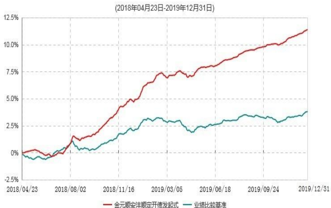
金元顺安洋顺定期开放债券型发起式证券投资基金累计净值增长率与业绩比较基准收益率历史走势对比图