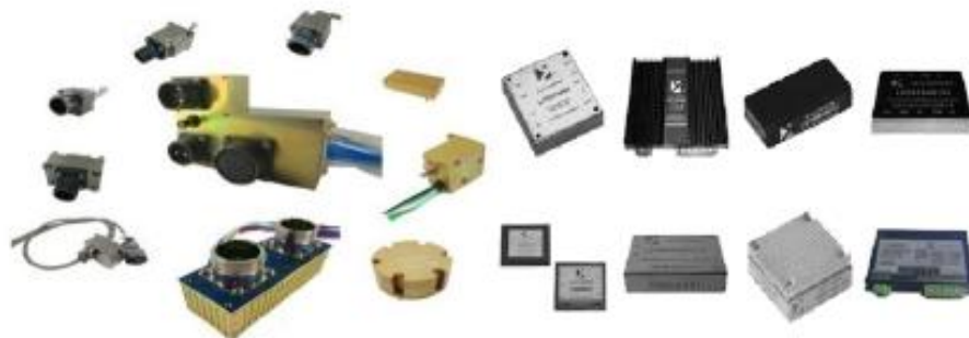
图二 滤波器组件、滤波电源模块与电源变换器模块