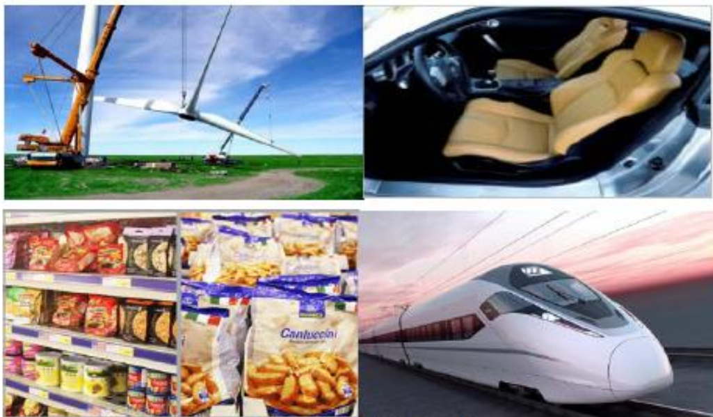
图一 公司胶粘剂产品主要应用领域

报告期内，公司产品主要包括环氧胶、聚氨酯胶、丙烯酸胶、SBS胶粘剂等八大系列、数百种规格型号的产品，产品广泛应用于风电叶片制造、软材料复合包装、轨道交通、船舶工程、汽车、电子电器、建筑、机械设备及工业维修等领域，其中丙烯酸胶、聚氨酯胶、风电叶片用环氧结构胶等多项产品性能达到或超过国际同类产品的水平。风电叶片用环氧胶主要服务客户包括多家大型国有企业、上市公司。