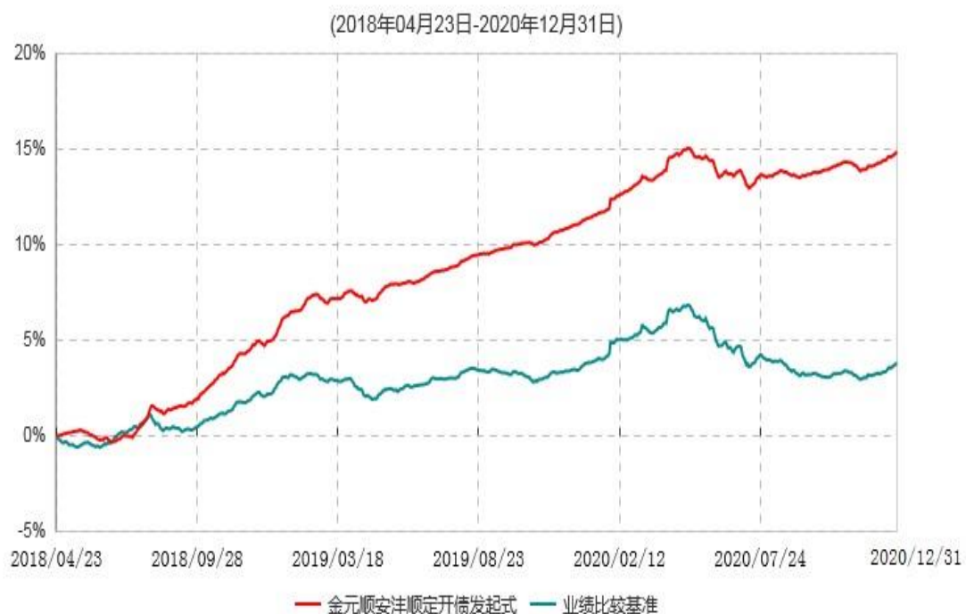
金元顺安洋顺定期开放债券型发起式证券投资基金累计净值增长率与业绩比较基准收益率历史走势对比图