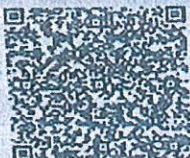
毛玥明年检二维码

本证书经检验合格, 继续有效一年。 This certificate is valid for another year after this renewal.