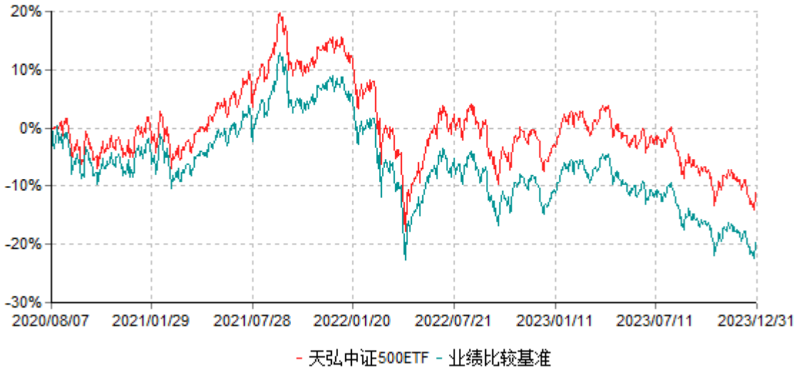
天弘中证500交易型开放式指数证券投资基金累计净值增长率与业绩比较基准收益率历史走势对比图 (2020年08月07日-2023年12月31日)

注：1、本基金合同于2020年08月07日生效。 2、本报告期内，本基金的各项投资比例达到基金合同约定的各项比例要求。