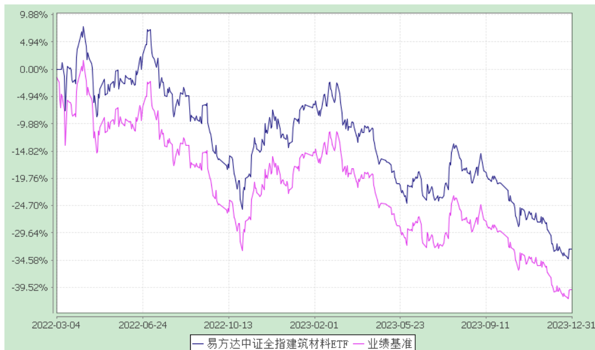
易方达中证全指建筑材料交易型开放式指数证券投资基金 份额累计净值增长率与业绩比较基准收益率历史走势对比图 (2022年3月4日至2023年12月31日)

注：自基金合同生效至报告期末，基金份额净值增长率为-32.60%，同期业绩比较基准收益率为-39.99%。