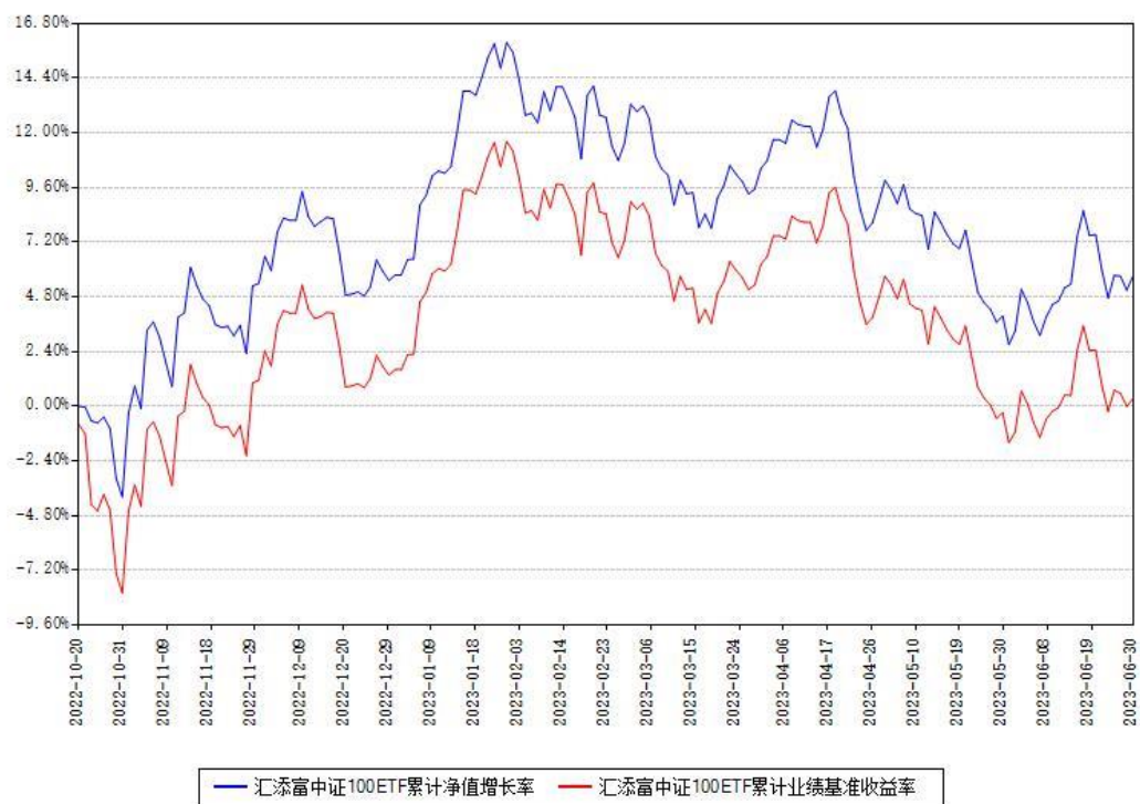
汇添富中证100ETF累计净值增长率与同期业绩基准收益率对比图