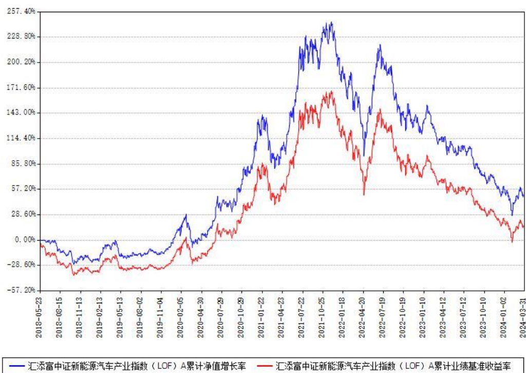
汇添富中证新能源汽车产业指数（LOF）A累计净值增长率与同期业绩比较基准收益率对比图