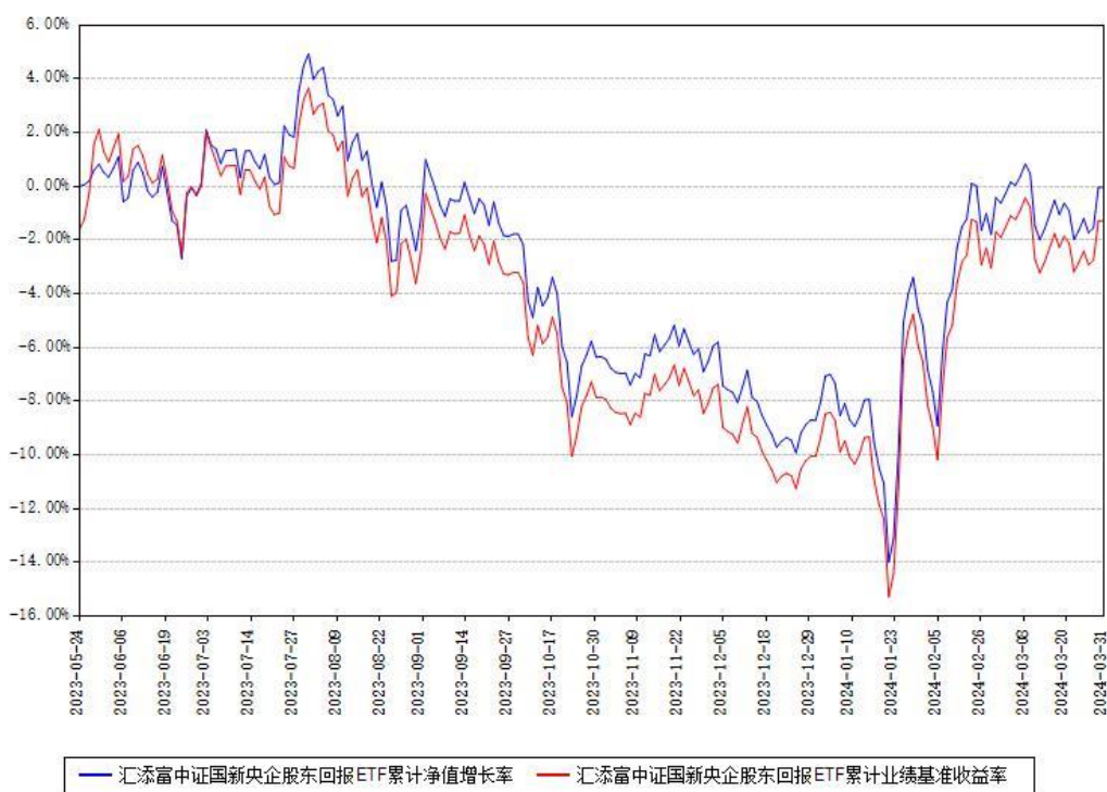
汇添富中证国新央企股东回报ETF累计净值增长率与同期业绩基准收益率对比图

(二) 自基金合同生效以来基金累计净值增长率变动及其与同期业绩比较基准收益率变动的比较图