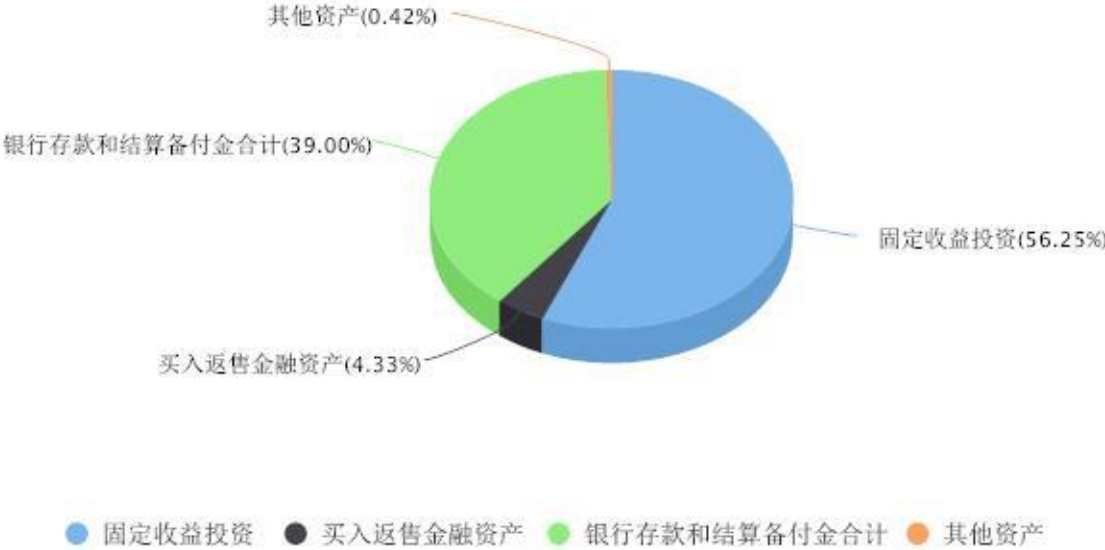
投资组合资产配置图表 数据截止日期:2023年09月30日