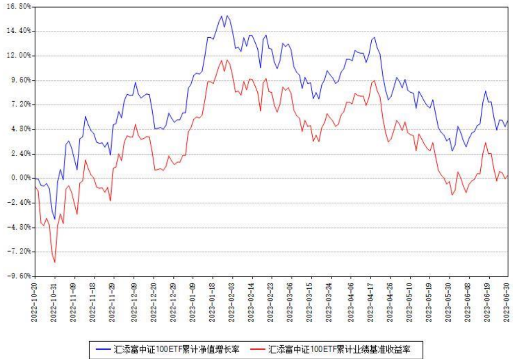
汇添富中证100ETF累计净值增长率与同期业绩基准收益率对比图