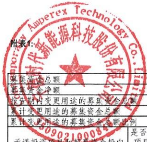
2024年度募集资金使用情况对照表