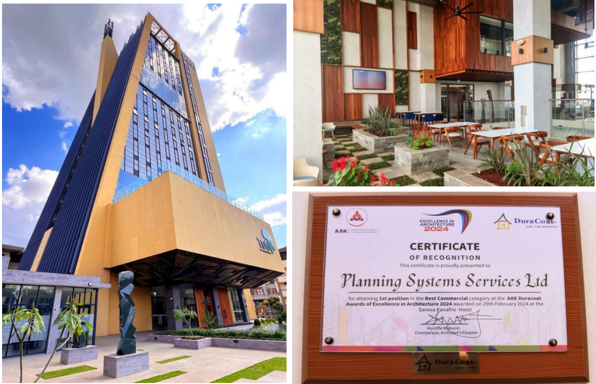
图为肯尼亚 TDB 项目荣获肯尼亚建筑协会 2024 年度建筑卓越奖

1. 积极参与“一带一路”建设。公司积极推进以肯尼亚为中心的东非区域化和以菲律宾为中心的东南亚区域化经营稳健发展，新设立马来西亚公司及印度尼西亚代表处，加快形成一体两翼发展格局。2024 年，新签合同总额 26.83 亿元，同比增长 61%。其中，新签约的菲律宾达沃快速交通系统第四标段设计施工项目，合同金额 9.96 亿元，系公司在东南亚地区承揽的最大金额市政工程项目；新签约的肯尼亚内罗毕智能交通系统建立和路口改善项目，合同金额 6.35 亿元，系公司承揽的第一个智慧交通项目。项目建成后对于改善“一带一路”沿线国家的基础设施建设及促进地方经济发展起到积极作用。