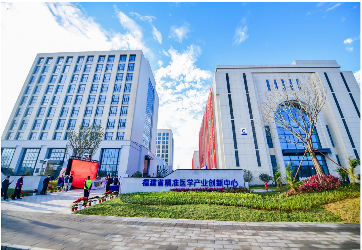
图为福建省精准医学产业创新中心

近年来，中国武夷致力于文旅开发、产城融合、精准医学等新兴业态的探索，努力加快业务转型升级，希望通过经营理念的不断提升、治理体系的不断变革，真正建成以客户为中心、依托高度的市场化运作、具有核心竞争力与品牌价值、为股东及社会创造更多价值的卓越企业。