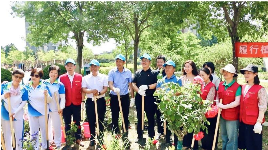
图为北京市义务植树进社区暨微花园建设启动仪式在武夷花园举行

5. 积极打造低碳社区。 北京武夷花园小区在街道、社区的帮助下，先后种植丰花月季、牡丹、紫荆花灌木等 3 万余株；此外，由北京武夷物业承办的北京市“义务植树进社区暨微花园建设启动仪式”在武夷花园月季园举行，在月季园内打造了一座约 150 平方米的景观花园。微花园的建设不仅能丰富园区景观，还能在社区内发挥吸附尘土、净化空气、减少噪声污染等调节生态的作用，为城市副中心绿色建设品牌建设作出示范。