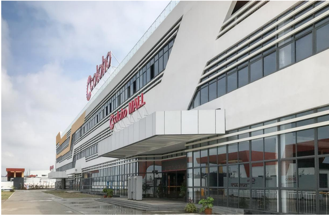
图为中武电商肯尼亚内罗毕 COLOHO 建材超市

要成果。下属中武电商公司积极响应“双循环”国家战略布局，坚持以跨境双向贸易为主、以国内贸易为辅，不断夯实供应链综合运营及服务基本盘业务。其经营的肯尼亚内罗毕 COLOHO 建材展销中心是东非最大建材家居专业卖场。