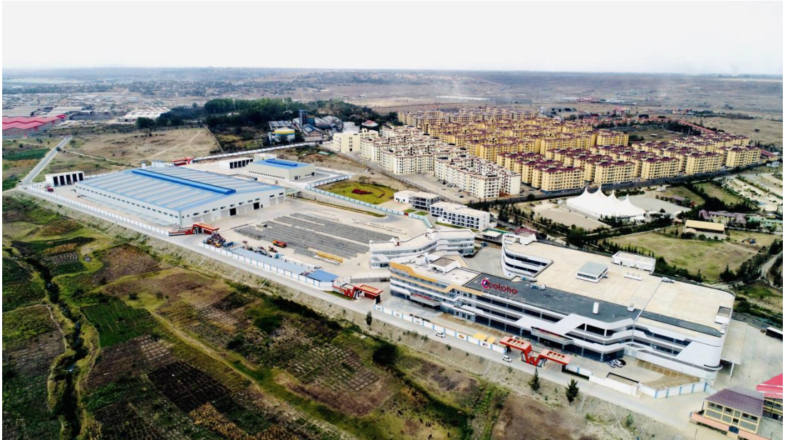
图为肯尼亚建筑工业化研发生产基地与建材超市

件生产工艺上采用新型环保材料，创新节能技术，充分利用资源，推动绿色建造，有效减少建筑项目资源、能源耗费量和建筑垃圾生成量。