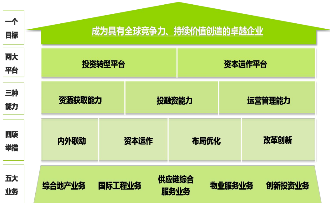
图为公司战略蓝图

为核心、供应链综合服务为支撑、物业管理和创新投资为辅助的业务组合，形成“两主两辅一支撑”的多元发展、战略协同的新格局。