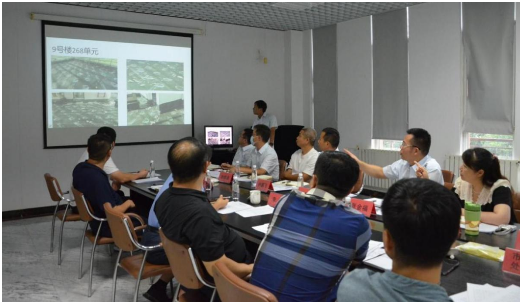
北京武夷物业主动融入街道社区调研协商，完善基层治理

（3）北京武夷物业积极打造红色物业品牌，党支部通过开展铲冰除雪、落叶清扫、垃圾清理、楼道美容等志愿活动，在不同岗位树立先锋模范榜样。此外，北京武夷物业与居委会、业委会和楼门长开展“联手行动”。在居委会设置基层议事厅，定期接受业主诉求，共同商议业主事务，实现 12345 热线受理与后台办理服务紧密衔接。以党建引领基层治理创新，切实担当新时代新使命。