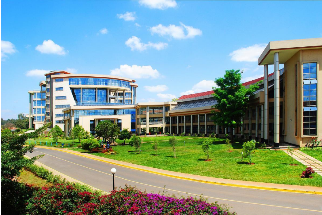
图为公司承建的肯尼亚金融研究学校项目

公司房地产业务立足福建，深耕香港、北京、南京、重庆等重点城市，相继开发了“武夷花园”“武夷嘉园”“武夷绿洲”“武夷名仕园”等多个经典楼盘品牌系列。近年来，为适应公司高质量发展及房地产行业发展的新形势，公司致力于文旅开发、产城融合、精准医学等新兴业态的探索，重点打造了重庆五桂堂历史文化商业街区、南安泛家居特色小镇、福建省精准医学产业创新中心等产业地产项目。