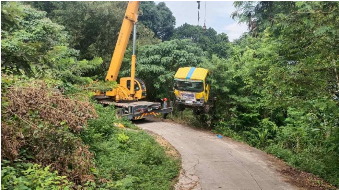
图为菲律宾塔威塔威纳斯桥项目部出动起重吊车救援侧翻事故车辆

打开挤压变形的车门救出了困在车厢里面的一家三口。中国武夷菲律宾塔威塔威纳斯大桥工程项目部的救援工作得到了当地村民的感谢和表扬，体现了中国武夷员工助人为乐，勇担社会责任，积极为社会作出贡献的精神。