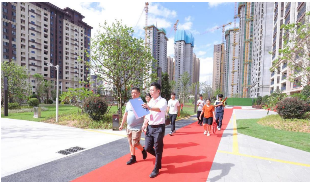
图为南安武夷时代天越项目交房现场

（2）向消费者保证诚信经营。 公司始终坚持国家对房地产市场的政策引导，回归房地产市场的居住属性；自觉执行商品房销售明码标价和价格备案制度，依法规范商品房预（销）售行为，保管好消费者的个人信息，提供良好的售后服务，妥善处理供应商、客户（消费者）等提出的投诉和建议。公司房地产项目积极贯彻保交楼政策，助力地方稳定民生，北京武夷西地块 4 幢住宅、福鼎武夷玉桐湾项目、南安武夷项目三期东区完成高质量竣备交付。