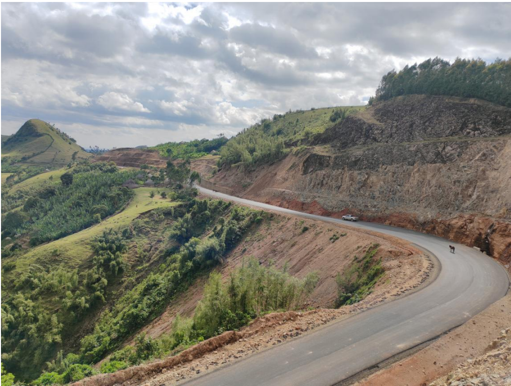
通车后的达耶公路悬崖路段

为确保当地居民生产生活所依靠的客车、三轮车、摩托、轻卡车等车辆能通行，项目部在施工段两端分别安排了安全员，定时开放道路，供社会车辆通行，当地车主也很支持项目的工作安排。受白天社会车辆影响，项目部安排班组晚间加班，开挖并运输石料，加快进度，争取早日拉通该段落。