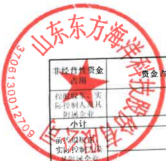
山东东方海洋科技股份有限公司2024年度非经营性资金占用及其他关联资金往来情况汇总表