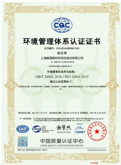
环境管理体系认证证书

公司持续开展 ISO14001-2015 环境管理体系认证标准，围绕环境方针“致力于污染及安全预防，不断提升环境及职业健康安全绩效；关注环境和职业健康安全风险变化，保持危机和变革意识，走可持续发展之路”设定环境管理方案、确定环境管理职责、考核环境管理绩效。