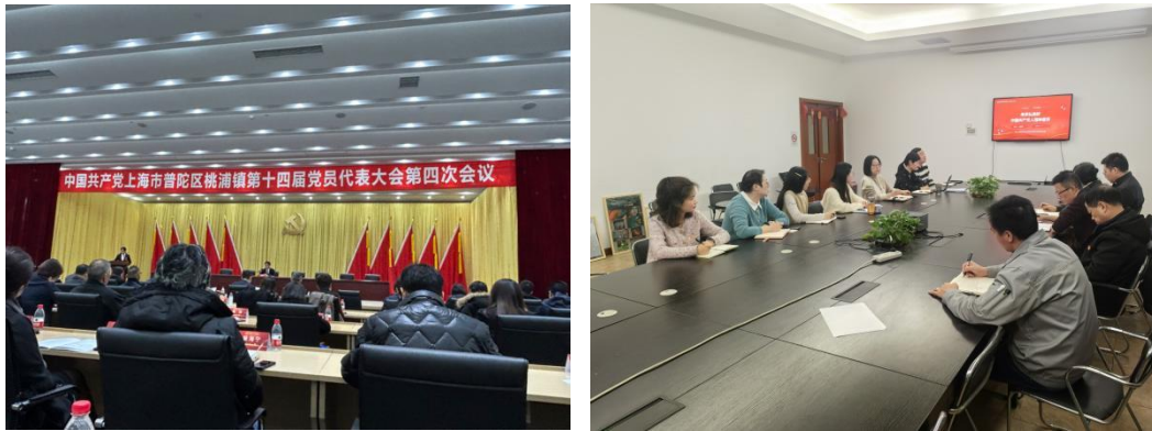
2024 年党员代表大会及党课学习现场

(2) 做实做细思想政治工作。 党纪教育与警示教育开展： 制定《2024 年党纪教育活动计划》，为全年的党纪教育工作提供明确指导与计划。组织党员观看《永远在路上》等警示教育片，通过真实案例的展示，深刻剖析腐败的内在逻辑及反腐败的必要性、长期性、复杂性。 线上平台利用与网络意识形态管理： 组织全体党员关注微信公众号“共产党员”，充分利用平台资源，定期推送平台优质文章、视频等学习资料。高度重视网络意识形态管理，严格规范微信、公众号、官网等网络工作纪律，建立健全信息发布审核制度，确保发布的信息准确、积极、正面，符合党的路线方针政策。加强对党员的网络行为教育，明确要求党员在使用自媒体时，不得传播谣言、负能量和不实信息。定期开展网络意识形态安全检查，及时发现并处理潜在的风险隐患，维护公司良好的网络形象与舆论环境。