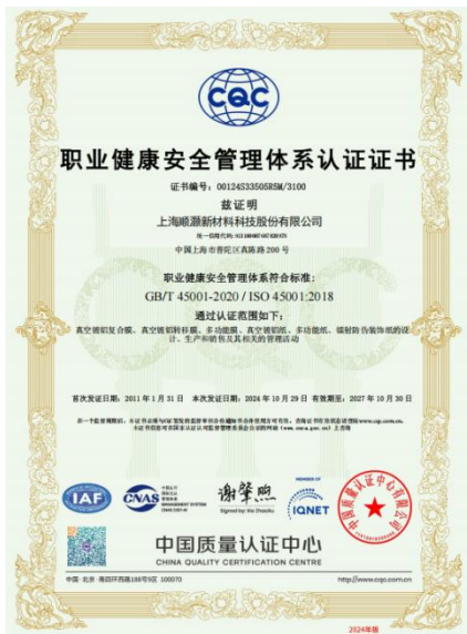
职业健康安全管理体系认证证书