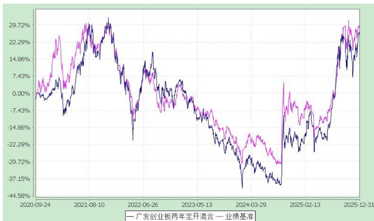
广发创业板两年定期开放混合型证券投资基金 份额累计净值增长率与业绩比较基准收益率的历史走势对比图 (2020 年 9 月 24 日至 2025 年 12 月 31 日)