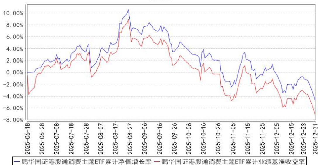
鹏华国证港股通消费主题ETF累计净值增长率与同期业绩比较基准收益率的历史走势对比图

注：1、本基金基金合同于 2025 年 06 月 18 日生效，截至本报告期末本基金基金合同生效未满一年。2、截至建仓期结束，本基金的各项投资比例已达到基金合同中规定的各项比例。