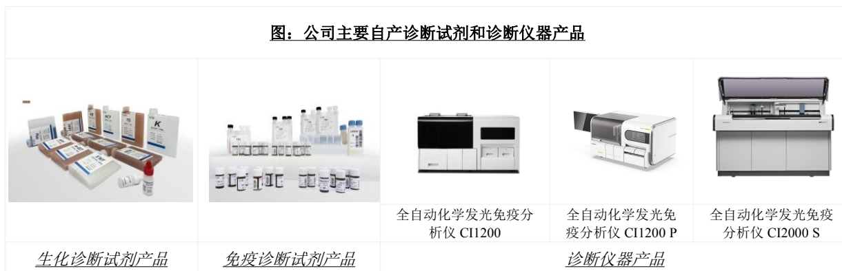
图：公司主要自产诊断试剂和诊断仪器产品