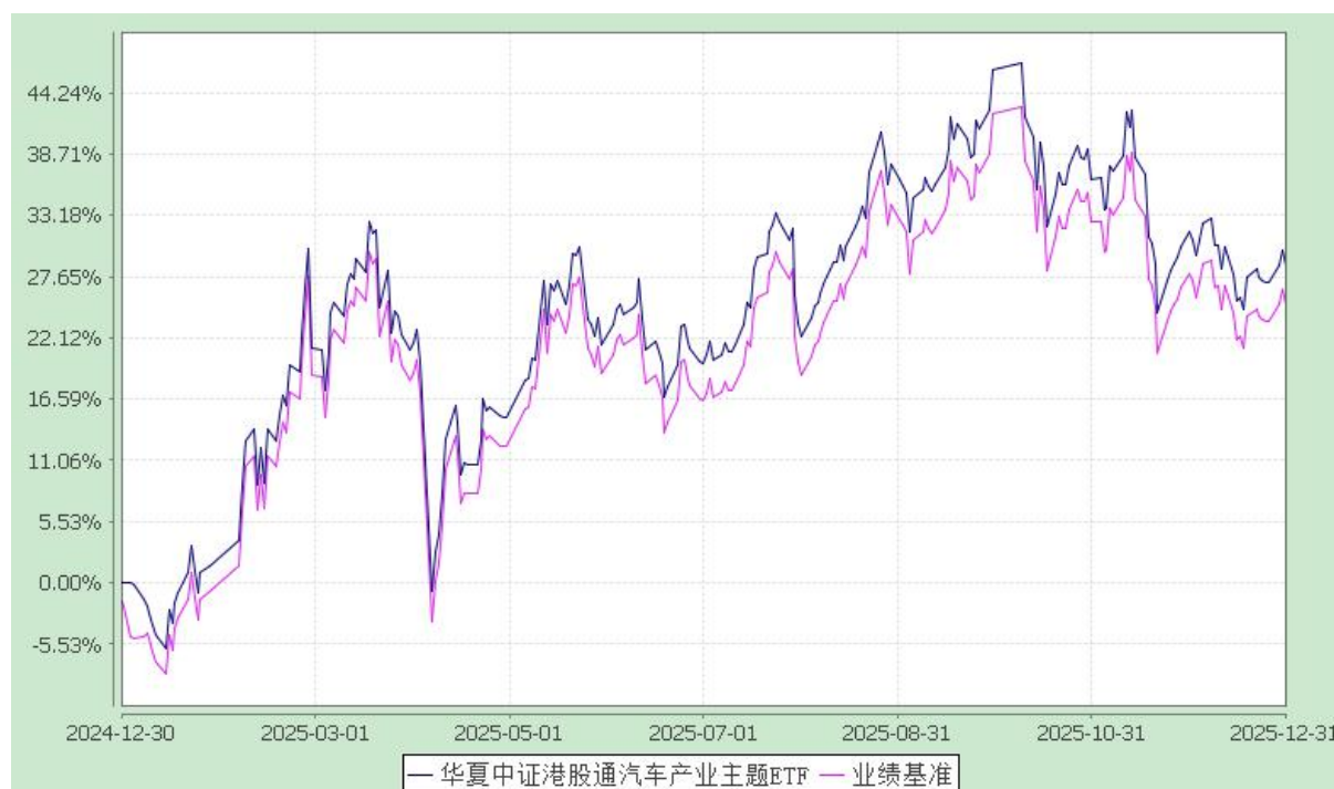
华夏中证港股通汽车产业主题交易型开放式指数证券投资基金 份额累计净值增长率与业绩比较基准收益率历史走势对比图 (2024 年 12 月 30 日至 2025 年 12 月 31 日)

注：根据本基金的基金合同规定，本基金自基金合同生效之日起 6 个月内使基金的投资组合比例符合本基金合同中投资范围、投资限制的有关约定。