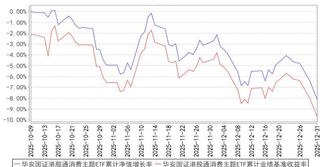
华安国证港股通消费主题ETF累计净值增长率与同期业绩比较基准收益率的历史走势对比图

注：本基金于 2025 年 10 月 9 日成立，截止本报告期末，本基金成立不满一年。