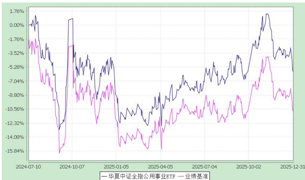
华夏中证全指公用事业交易型开放式指数证券投资基金 份额累计净值增长率与业绩比较基准收益率历史走势对比图 (2024 年 7 月 10 日至 2025 年 12 月 31 日)

注：根据本基金的基金合同规定，本基金自基金合同生效之日起 6 个月内使基金的投资组合比例符合本基金合同中投资范围、投资限制的有关约定。