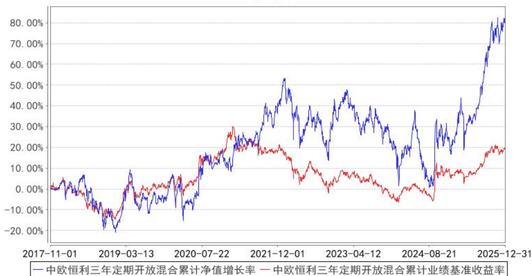
中欧恒利三年定期开放混合累计净值增长率与同期业绩比较基准收益率的历史走势对比图