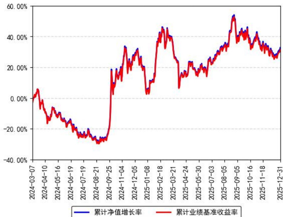
南方中证全指计算机ETF累计净值增长率与同期业绩比较基准收益率的历史走势对比图