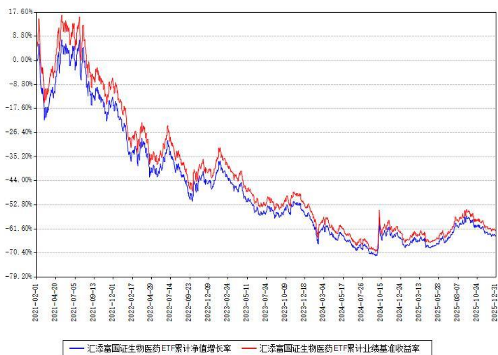
汇添富国证生物医药ETF累计净值增长率与同期业绩比较基准收益率对比图

注：本基金建仓期为本《基金合同》生效之日（2021年02月01日）起6个月，建仓期结束时各项资产配置比例符合合同约定。