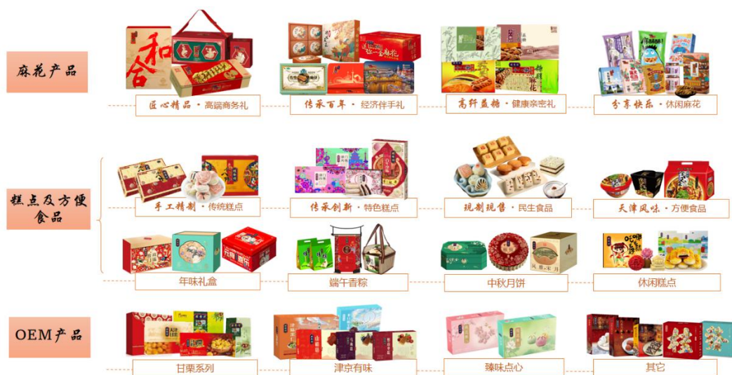
公司自有品牌产品图示

桂发祥是专业从事传统特色及其他休闲食品的研发、生产和销售中华老字号企业。经多年发展，集合自身优势特点，形成“品牌+研发+生产+销售”一体化的综合型企业。公司所属行业为食品制造业，同时通过以直营店为主，经销商、商超及电子商务等相结合的营销体系，开展销售业务。公司产品包括以十八街麻花为代表的传统特色休闲食品，以及糕点、天津风味方便食品、甘栗及传统小食等其他休闲食品；主打产品为“桂发祥十八街”系列麻花，其制作技艺被评为国家级非物质文化遗产代表性项目，是我国传统特色饮食文化的代表之一，以酥脆香甜、久放不绵等优点享誉国内外。