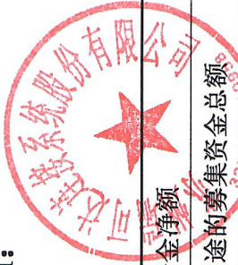
2022 年向特定对象发行股票募集资金使用情况对照表