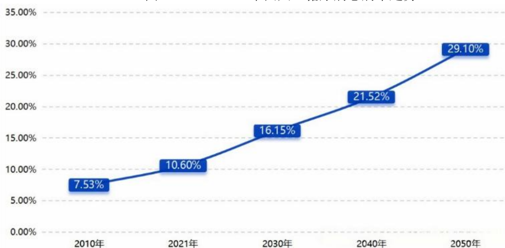
图 1：2010-2050 中国人口糖尿病患病率趋势

近年来，我国超重和肥胖人群的患病率也呈持续上升趋势，《中国居民营养与慢性病状况报告（2020 年）》显示，全国 \geq 18 岁人群超重率为 34.3%，肥胖率为 16.4%，比 2015 年分别上升了 4.2 和 4.5 个百分点，《世界肥胖地图 2025》预测，中国成年人高 BMI（ BMI \geq 25\text{kg}/\text{m}^2 ）人数将从 2010 年的 2.73 亿攀升至 2030 年的 5.15 亿。