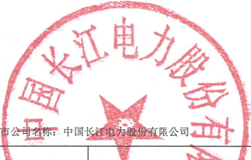
2025年度非经营性资金占用及其他关联资金往来情况汇总表