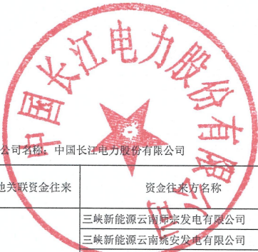
2025年度非经营性资金占用及其他关联资金往来情况汇总表