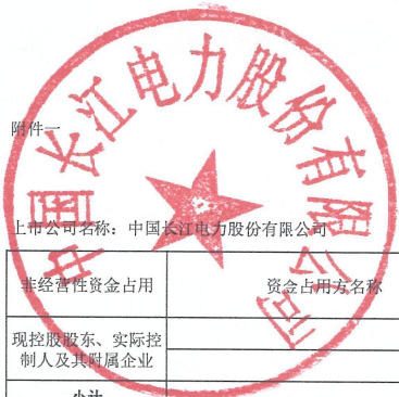
2025年度非经营性资金占用及其他关联资金往来情况汇总表